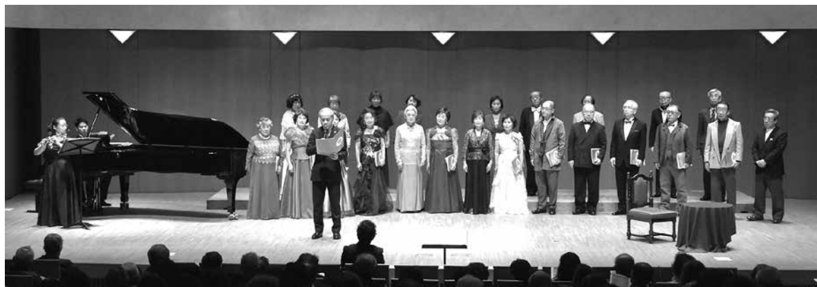
2018年2月25日 15周年記念特別コンサートより