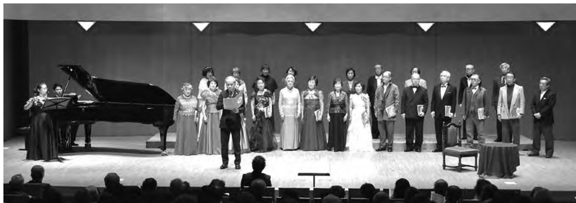
2018年2月25日 15周年記念特別コンサートより