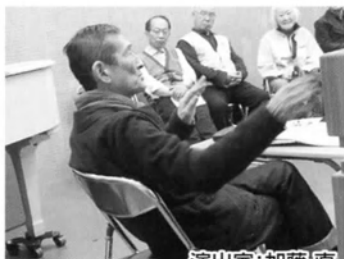
演出家: 加藤 直