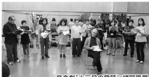
音楽劇「十三月の童話」: 練習風景